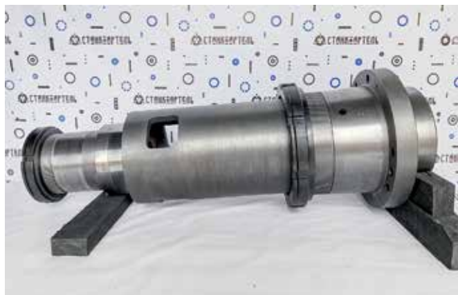
Рис. 5. Шпиндельный узел станка UBB-112

шпиндельной бабки, шпиндель (рис. 5), пиноль, центр пиноли, винт-гайка перемещения пиноли, коническая пара подъемника и другие. Также в наличии запасные части токарно-накатного станка РТ301.