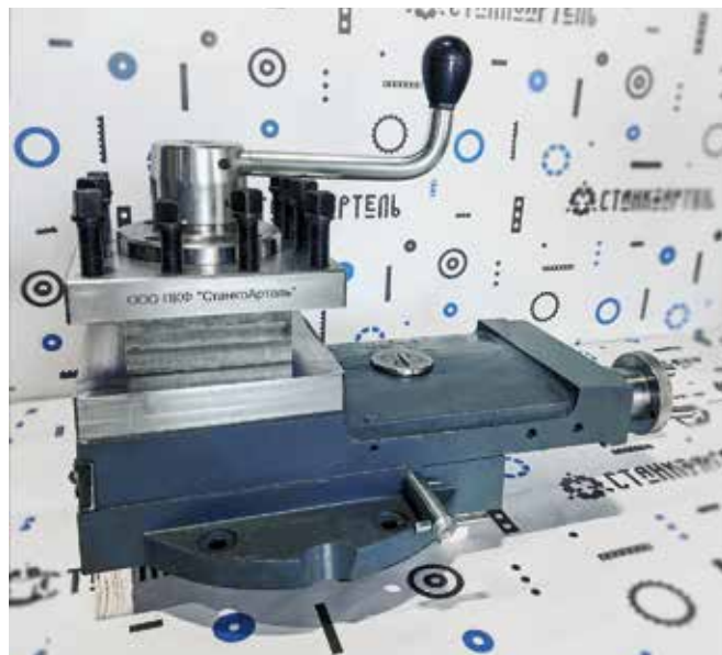
Рис. 1. Суппорт станка 1М63 в сборе

Для ремонта револьверных головок 1П756ДФЗ.39, 1П756ДФЗ.40, 16М30, 16К30 в наличии широкий перечень запасных частей: основание, полумуфты (рис. 4), диски, колеса зубчатые, собачки, оси, валы, водило, стакан, фиксаторы и другие.