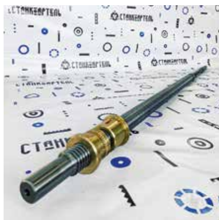
Рис. 2. Винт-гайка каретки моделей 1Н65, РТ117, РТ317, РТ817, РТ917

Для нужд вагонноремонтных депо на складе ПКФ «СтанкоАртель» регулярно восполняется наличие запчастей для станков UBВ-112, UBВ-112/РГ, UDA-112, UBС-150, UCB-125, РТ905, КЗТС1836: секторы (кулачки) зажима колесных пар, шариковая пара перемещения суппорта, резцедержатели, касеты, поводок зажима колесной пары, ползушка поводка, гидрочилиндр поводка, корпус планшайбы, венец планшайбы, подвенечная шестерня планшайбы, винт-гайка перемещения