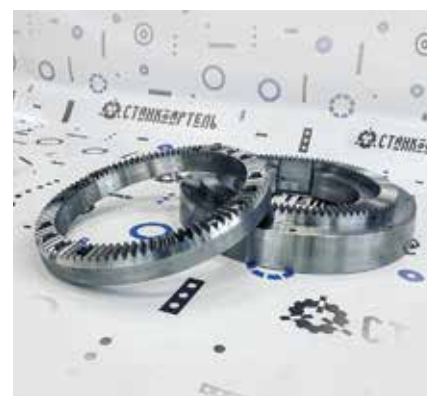
Рис. 4. Комплект полумуфт с зубчатым соединением Хирта для револьверной головки 1П756ДФЗ.39