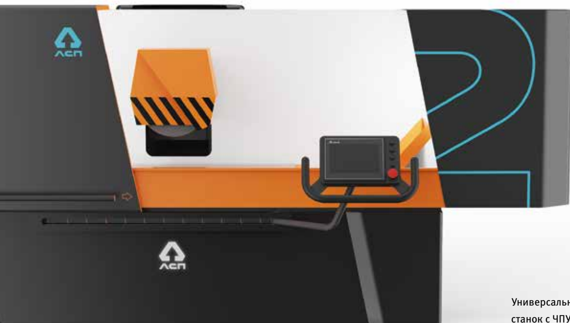
Универсальный плоскошлифовальный станок с ЧПУ ЛШ722